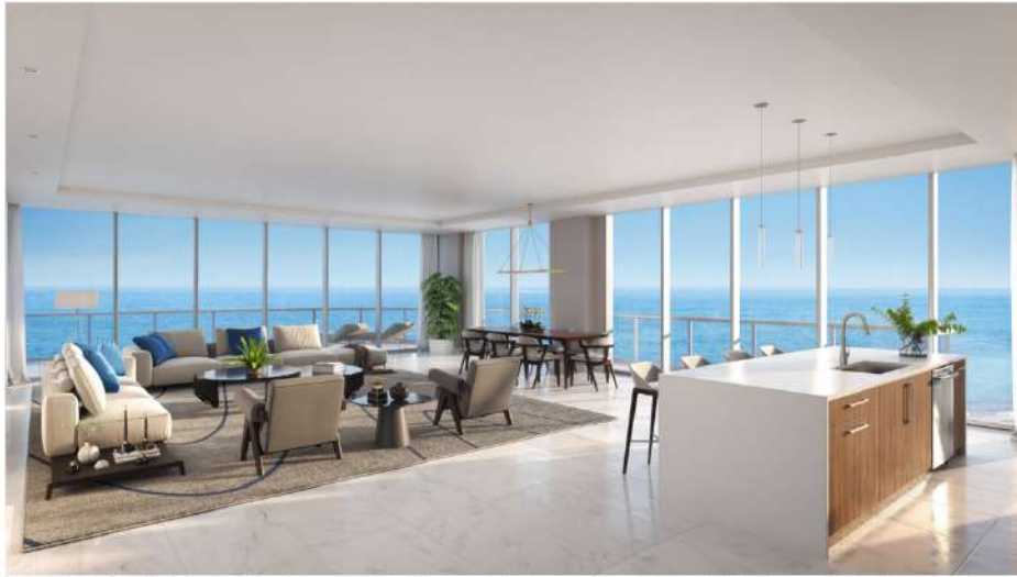
Selene Oceanfront Residences tiene vistas a playa Las Olas, considerada la mejor de Fort Lauderdale