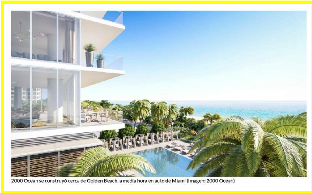
2000 Ocean se construyó cerca de Golden Beach, a media hora en auto de Miami