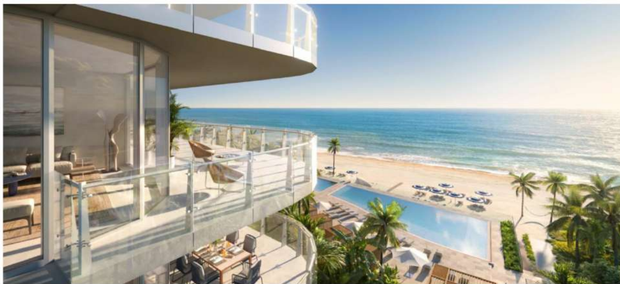
Una de las torres de The Ritz-Carlton Residences, a 64km de Miami Beach, tendrá vistas a la playa Pompano

The Ritz Carlton Pompano Beach, Selene Oceanfront Residences y 2000 Ocean son opciones residenciales de lujo en la costa este de Florida, cerca de Miami, con panorámicas de playas perfectas y servicios 5 estrellas